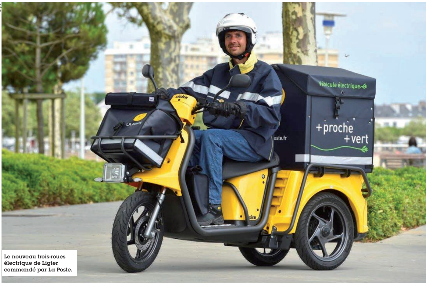
Le nouveau trois-roues électrique de Ligier commandé par La Poste.

► Conscient de ces avantages, des constructeurs spécialisés et généralistes ont développé une offre de véhicules utilitaires et de camions électriques, allant de 200 kg à 2 tonnes de charge utile. S'autorisant jusqu'à 850 kg de charge utile et 100 km d'autonomie, les Goupil G3 et G5, Univers VE Helem Colibus, Mega e-worker, Alké ATX et Piaggio Porter constituent l'offre la plus légère, avec le Renault Twizy désormais décliné en version Cargo. Les