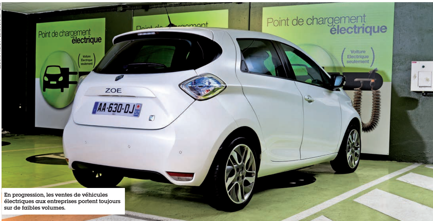
En progression, les ventes de véhicules électriques aux entreprises portent toujours sur de faibles volumes.