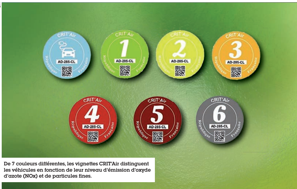
De 7 couleurs différentes, les vignettes CRIT'Air distinguent les véhicules en fonction de leur niveau d'émission d'oxyde d'azote (NOx) et de particules fines.

Le projet de loi relatif à la transition énergétique pour la croissance verte a été adopté le 22 juillet 2015.