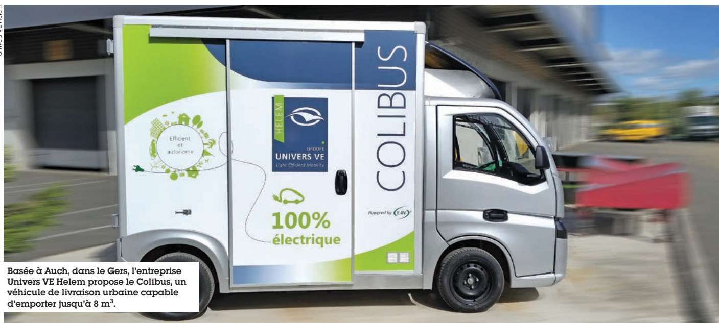
Basée à Auch, dans le Gers, l'entreprise Univers VE Helem propose le Colibus, un véhicule de livraison urbaine capable d'emporter jusqu'à 8 m 3 .