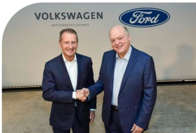
Herbert Diess, président du directoire de Volkswagen (à gauche), et Jim Hackett, PDG de Ford.