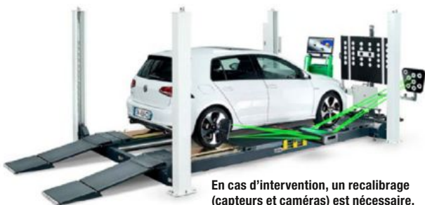
En cas d'intervention, un recalibrage (capteurs et caméras) est nécessaire.

Deux niveaux d'habilitation sont requis : le niveau B0L/B1L, pour les conseillers clients, préparateurs VN, réceptionnaires, techniciens et carrossiers non-électriciens ; le niveau B2VL/BCL, pour les chargés de consignation et les chargés de travaux. Ces habilitations, valables trois ans, sont proposées sur une, deux ou trois journées par le GNFA, l'Apave et tout autre organisme de formation habilité. ●